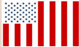
Drapeau civil des États-Unis

Ils doivent d'abord se convertir de personnes naturelles en Personnes artificiels en traversant la Juridiction Terrestre pour accéder au BARREAU